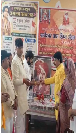
धाम शिष्य मंडल के भक्त गणों