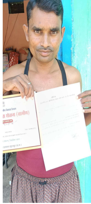
वन विभाग की है और अतिक्रमण हटाना है तो कार्रवाई सभी पर समान रूप से क्यों