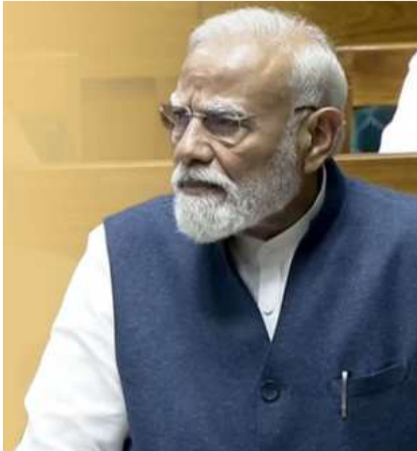
अब वे केवल स्थानीय निकायों तक सीमित नहीं रहना चाहतीं, बल्कि नीतियों और फैसलों पर भी प्रभाव डालने की स्थिति में हैं।

भाग्यशाली मान सकते हैं कि इस परिवर्तन के दौर के साक्षी बन रहे हैं। प्रधानमंत्री ने अपने संबोधन में कहा कि इस गहन चर्चा से सकारात्मक परिणाम निकलेंगे, जो आने वाले समय में देश की दिशा और विकास को तय करेंगे। उन्होंने माना कि यह कदम पहले भी उठाया जा सकता था, लेकिन अब जो अवसर मिला है, वह बेहद महत्वपूर्ण है और इसमें सभी जनप्रतिनिधियों की भूमिका अहम है। उन्होंने आगे कहा कि आज का दिन देश के लिए निर्णायक है। पिछले दो-तीन दशकों में जमीनी स्तर पर महिलाओं ने अपनी नेतृत्व क्षमता को साबित किया है और