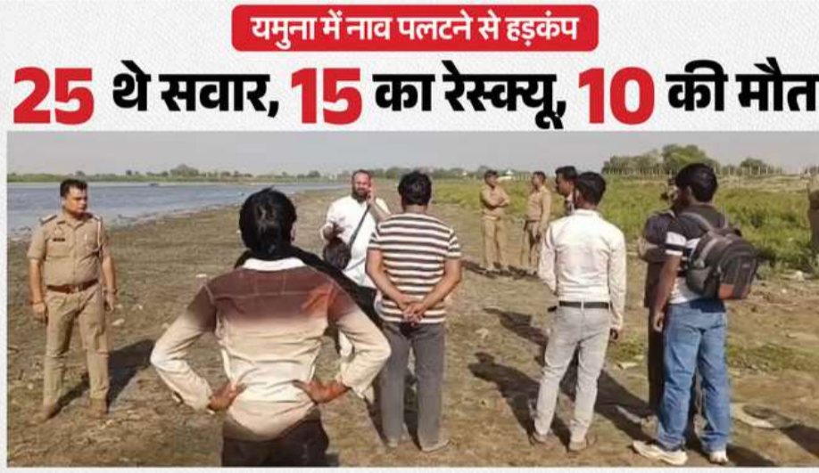
यमुना में नाव पलटने से हड़कंप

वृंदावन और मान के बीच यमुना नदी में शुक्रवार को एक नाव पलटने का हादसा हुआ। इस दुर्घटना में कई लोग यमुना में डूब गए। यह घटना केसी घाट के पास हुई। पुल वृंदावन और मान के बीच बना हुआ है। उत्तर प्रदेश के वृंदावन में शुक्रवार दोपहर एक बड़ा हादसा हो गया। केसी घाट पर श्रद्धालुओं से भरी एक नाव पलटने से टकराकर यमुना नदी में पलट गई। पुलिस और स्थानीय प्रशासन मिलकर बड़े पैमाने पर बचाव अभियान चलाया। गोताखोर यमुना के गहरे पानी में डूबे हुए लोगों की तलाश में जुटे हैं। 10 श्रद्धालुओं की मौत - इस