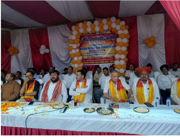
विद्यालय प्रशासन द्वारा वार्षिक परीक्षा में उत्कृष्ट प्रदर्शन करने