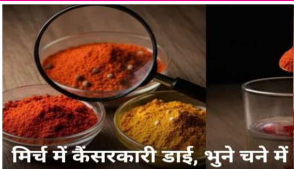
मिर्च में कैसरकारी डाई, भुने चने में