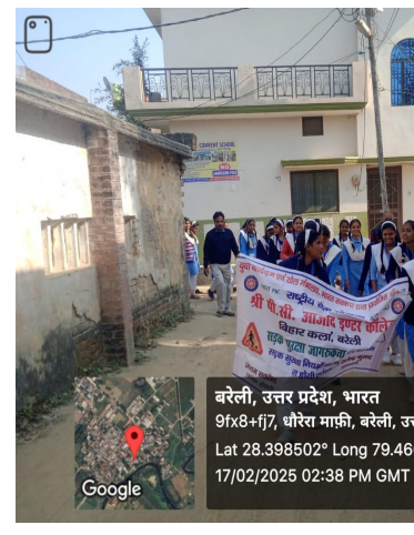
बरेली, उत्तर प्रदेश, भारत 91x8+17, धीरे माफ़ी, बरेली, उत्तर प्रदेश 243006, भारत Lat 28.398502° Long 79.466384° 17/02/2025 02:38 PM GMT +05:30