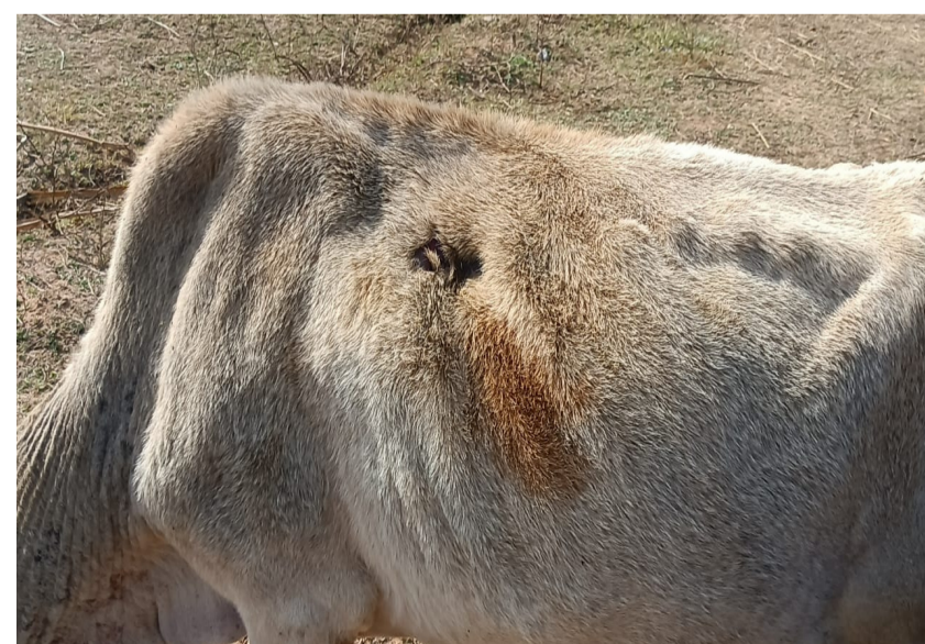
Latitude: 23°17'12"N Longitude: 83°10'53"E Elevation: 607.79±22 m Accuracy: 3.9 m Time: 01-02-2025 11:10 Note: Kutch kramank p.2557 bil dwara

छोड़कर सुरक्षित स्थानों पर शरण ले रहे हैं। हाथी के हमलों से जहां ग्रामीणों का जीवन संकट में है, वहीं उनकी संपत्ति और मवेशी भी खतरे में हैं। वन विभाग की निष्क्रियता वन विभाग की ओर से अब तक दंतैल हाथी को काबू में करने या ग्रामीणों को सुरक्षित स्थानों पर पहुंचाने के लिए कोई ठोस कदम नहीं उठाया गया है। विभाग का सारा कामकाज केवल हाथी मित्र दल पर निर्भर है, जो स्थिति को संभालने में नाकाम साबित हो रहा है। जरूरत ठोस कार्रवाई की हाथी के उत्पात को रोकने और ग्रामीणों को राहत देने के लिए वन विभाग को तत्काल प्रभाव से ठोस कदम उठाने होंगे। प्रशिक्षित कर्मियों की तैनाती, हाथी को नियंत्रित करने की रणनीति और प्रभावित परिवारों को मुआवजा देना समय की मांग है। सरकार और प्रशासन से अपील ग्रामीणों ने सरकार और प्रशासन से अपील की है कि वे इस समस्या का स्थायी समाधान निकालें। यदि समय रहते कदम नहीं उठाए गए, तो आने वाले दिनों में स्थिति और भी भयावह हो सकती है।