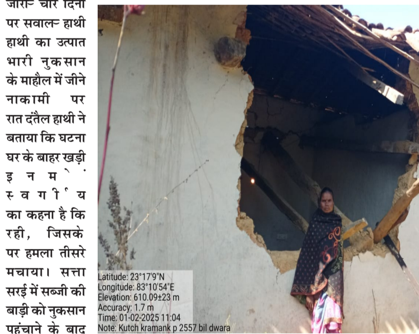
Latitude: 23°17'9"N Longitude: 83°10'54"E Elevation: 610.09±23 m Accuracy: 1.7 m Time: 01-02-2025 11:04 Note: Kutch kramank p.2557 bil dwara