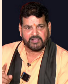
कहा कि जब इन दिया तो कहते थे बचाने आए हैं। याचिका दाखिल रोकने की मांग उन्होंने पहलवान द्वारा भारतीय ले कर दिल्ली