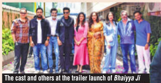
The cast and others at the trailer launch of Bhaiyya Ji