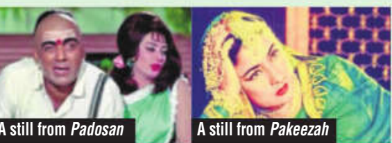
A still from Padosan