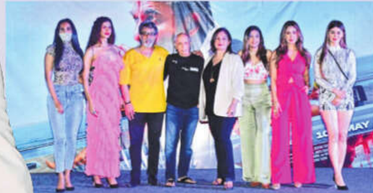
Deepak Tijori with Mahesh Bhatt and his daughter Pooja Bhatt and others

A ctor Deepak Tijori is set to mark his directorial comeback with the upcoming film Tipppsy , which is a story of five girls whose lives change after they embark on a bachelorette trip to Goa. The trailer of the film was unveiled at an event in Mumbai on Thursday and it was graced by Tijori's best friend Pooja Bhatt and maverick filmmaker Mahesh Bhatt. "The film is going to be a hit! It's in tandem with the current age and time and it caters to the pace of the current generation. The film has a good concept, vitality and sensuality so it will definitely work. Through this film, the audience will get to see the writer that Deepak is," Mahesh Bhatt stated. "Times are fast changing and if you don't keep up with the kind of content the young generation wants and consumes, you'll be left behind. And Deepak has understood it pretty well. Slow and inward-looking movies have had their time. Now, it's an era when