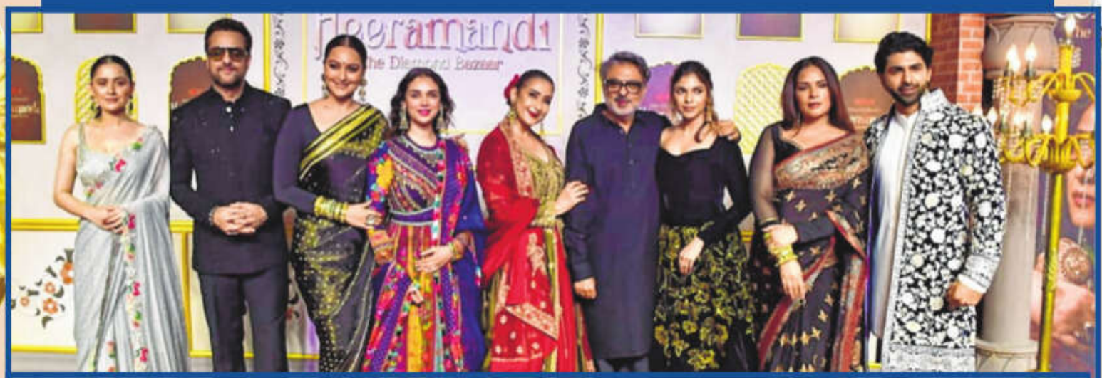
Sanjeeda Sheikh, Fardeen Khan, Sonakshi Sinha, Aditi Rao Hydari, Manisha Koirala, Sanjay Leela Bhansali, Sharmin Segal, Richa Chadha, Taha Shah Badusha