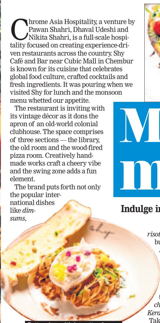
Fettuccine with burrata cheese