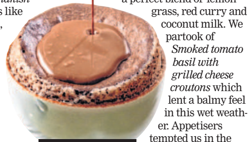
Molten lava soufflé

risotto, flatbreads, and Zaataar manakish but also a few street food delights like Avocado bhel, Mexican sev puri, Kottu roti (veg or chicken) of Malabar parotta served alongside Madras Railway Curry . Plenty of delightful options for non-vegetarians too from Shawarma, Butter chicken, Goan style fish curry to Kerala style biryani . Take your pick of hearty Tibetan