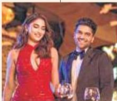
A still from Kuch Khattaa Ho Jaay