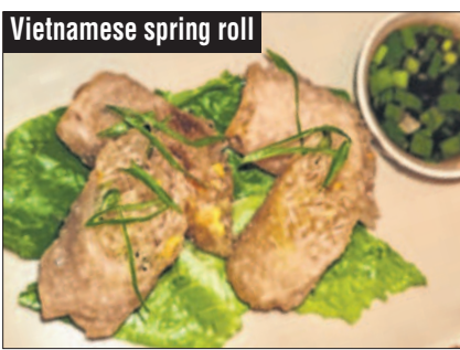
Vietnamese spring roll

risotto, flatbreads, and Zaataar manakish but also a few street food delights like Avocado bhel, Mexican sev puri, Kottu roti (veg or chicken) of Malabar parotta served alongside Madras Railway Curry . Plenty of delightful options for non-vegetarians too from Shawarma, Butter chicken, Goan style fish curry to Kerala style biryani . Take your pick of hearty Tibetan