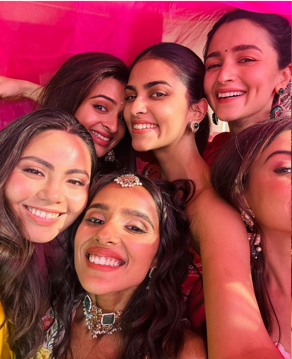
pre-wedding function - Alia Bhatt's name is currently making headlines for attending the

Alia Bhatt is that actress who can win everyone's heart with her beauty. Recently Alia has come to attend the pre-wedding function of her friend's wedding. During this time, Alia's latest pictures have surfaced on social media in which Alia is seen having fun with her bestie.