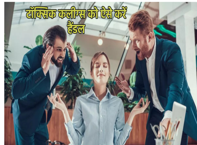
टॉक्सिक कलीम्स को ऐसे करें हैंडल

Office Etiquette You meet many types of people in the office. There are smart workers who work wholeheartedly, hard workers and some who do not work at the same time and some create obstacles in the work of others through various maneuvers. This last category is of toxic people who can trouble you mentally at times, so today we are going to know how to deal with them. Are there some people in your office who give you mental pressure? Ways to