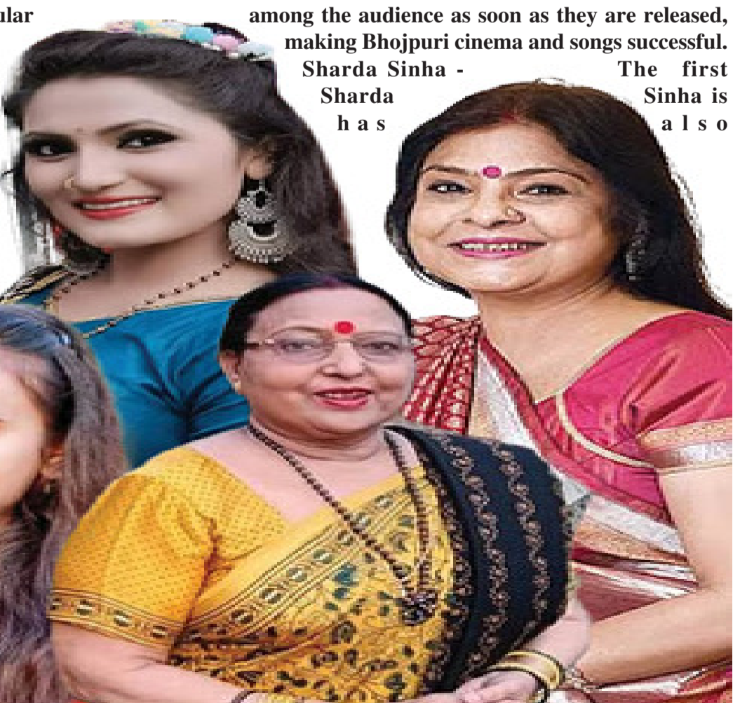
among the audience as soon as they are released, making Bhojpuri cinema and songs successful. Sharda Sinha - The first Sharda Sinha is has also