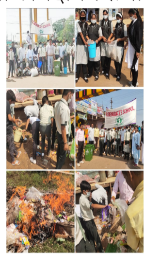
में स्वच्छता हेतु विभिन्न कार्यक्रम भी आयोजित किए गए।