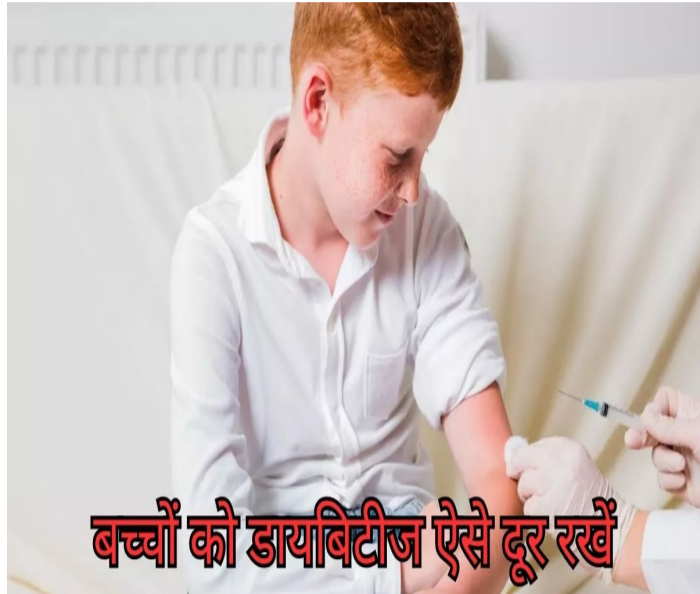
बच्चों को डायबिटीज ऐसे दूर रखें

These days the changing lifestyle of people has started affecting their children as well. Due to wrong eating and habits, children become victims of many problems at a young age. Type 2 diabetes is one of these whose risk is increasing rapidly. In such a situation, by adopting these tips, you can keep your children away from this disease. These days the effect of rapidly changing lifestyle is being seen on the physical and mental health of the people as well. Due to