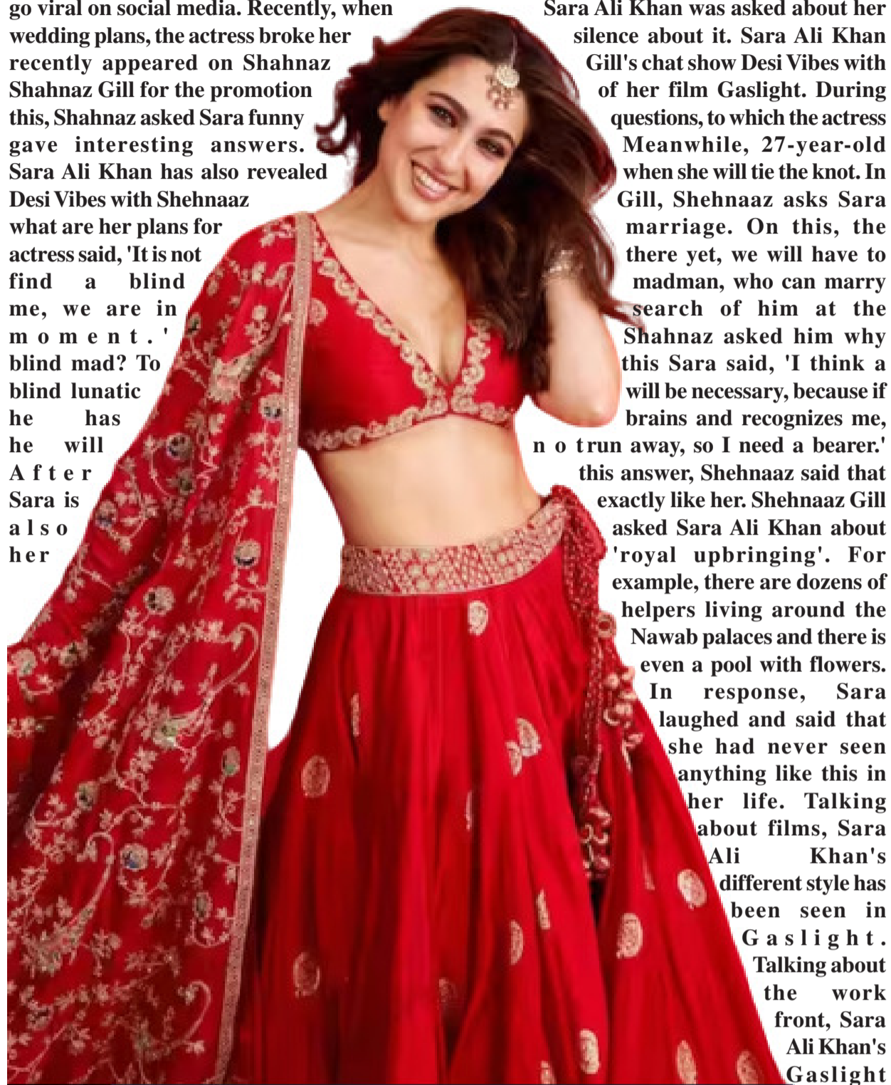
has been released on Hotstar on March 31, 2023. Apart from Sara, Chitrangada Singh and Vikrant Massey are in lead roles in the film. Apart from Gaslight, Sara Zara Hatke Zara Bachke, Ae Watan Mere Watan and Metro will be seen in films these days.

Sara Ali Khan is also called Nawabzadi of B-Town. Recently the actress' film Gaslight has been released. People have not liked Sara Ali's acting in this film at all. Apart from films, Sara Ali Khan is also known for her flirtatious style. Many times his funny talks and videos also go viral on social media. Recently, when wedding plans, the actress broke her recently appeared on Shahnaz Shahnaz Gill for the promotion this, Shahnaz asked Sara funny gave interesting answers. Sara Ali Khan has also revealed Desi Vibes with Shehnaaz what are her plans for actress said, 'It is not find a blind me, we are in moment.' blind mad? To blind lunatic he has he will After Sara is also her