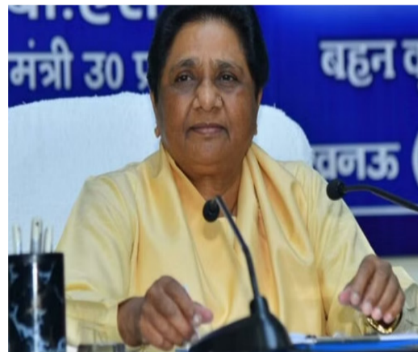
और 1995 में गेस्ट हाउस कांड

बसपा सुप्रीमो मायावती ने कहा कि सपा का दलितों के प्रति प्रेम अचानक बढ़ गया है लेकिन यह समाज कभी भी इनका नहीं हो सकता है। उन्होंने भाजपा पर भी जमकर प्रहार किए। बसपा प्रदेश मुख्यालय पर पार्टी के पदाधिकारियों के साथ समीक्षा बैठक करते हुए पार्टी सुप्रीमो मायावती ने सपा और भाजपा दोनों पर निशाना साधा। उन्होंने कहा कि यदि सपा एहसान फरामोशी नहीं करती