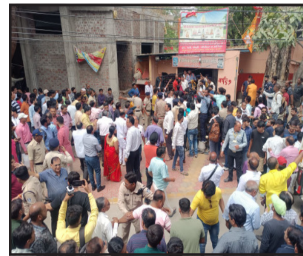
निकाला गया है। कलेक्टर और प्रशासन की टीम सूचना मिलते ही यहां पहुंच गए।

इंदौर, ऑनलाइन डेस्क। रामनवमी के मौके पर इंदौर में एक बड़ा हादसा हो गया है। दरअसल, श्री बेलेश्वर महादेव झूलेलाल मंदिर में छत ढहने से कुछ श्रद्धालु बावड़ी में गिर गए, जिन्हें बचाने का कार्य जारी है। बताया जा रहा है कि अधिकारियों को इस बावड़ी की कोई जानकारी नहीं थी, हादसे के बाद उन्हें इसका पता चला है। इस हादसे में अब तक 12 श्रद्धालुओं को बाहर निकाला जा चुका है। वहीं, बताया जा रहा है कि इसमें एक महिला की मौत हो गई है।