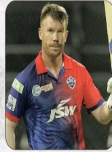
डेविड वॉर्नर 5226 रन