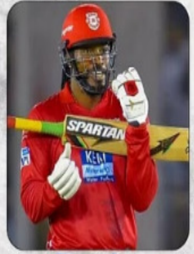
क्रिस गेल 4480 रन