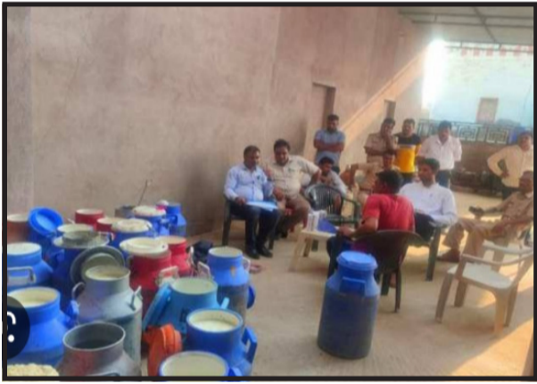
पंजीकरण कराया है। खाद्य उत्पाद तैयार करने के लिए 861 दुकानदारों को लाइसेंस दिये गये हैं। जिले के जलेसर में सर्वाधिक डेरियां एवं चिलर संचालित हैं। वहां दूध संकलन का काम होता है। उन्होंने बताया कि जलेसर क्षेत्र में लगभग 50 डेरियां, 20-25 चिलर संचालित हो रहे हैं। चिलर पर पांच से 10 हजार लीटर दूध संकलित किया जाता है। डेरियों पर दूध एवं दूध से बनने वाले उत्पाद तैयार किये जाते हैं। उन्होंने बताया कि होली पर दूध और दुग्ध उत्पादों की डिमांड बढ़ जाती है। दूध का काम करने वाले लोग ही दूध, घी, पनीर, मावा तैयार का बाजार में बेचते हैं। उनमें से ही 50 लोग अधिक मांग को देखते हुए मिलावटखोरी भी करते हैं। ऐसे लोगों के विरुद्ध विभाग अभियान चलाकर कार्रवाई करता है। इसी प्रकार घी बनाने में वनस्पति, नारियल और केमिकल मिलाये जाते हैं। सेंथेटिक दूध में भी केमिकल्स का प्रयोग किया जा रहा है। इसकी जांच विभाग की ओर से की जाती है। दो भैस से लेकर डेरियां संचालक दूध व

निशाकांत शर्मा दैनिक क्यूं न लिखूं सच एटा- होली को लेकर जिले में लगभग 50 डेरियां दुग्ध उत्पाद बनाने का काम कर रही हैं। इसके अलावा 20 से 25 चिलर दूध संकलन का काम कर रहे हैं। होली को देखते हुए दूध और दुग्ध उत्पादों की डिमांड बढ़ेगी। बड़ी डिमांड को देखते हुए जिले में मिलावटखोर भी सक्रिय हो गए हैं। वह मुनाफाखोरी के लिए जनमानस के स्वास्थ्य से खिलवाड़ करने से पीछे नहीं हट रहे हैं।