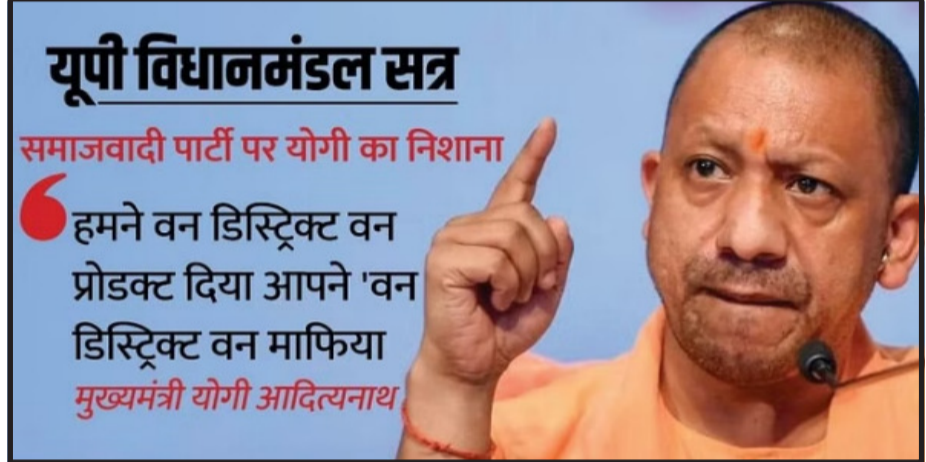
यूपी विधानमंडल सत्र समाजवादी पार्टी पर योगी का निशाना

षड्यंत्र को भला कौन भुला सकता है। इसका दुर्भाग्यपूर्ण परिणाम इन वर्गों को आज तक भुगतना पड़ रहा है। उन्होंने कहा कि यह बसपा विरोधी पार्टियों के षड्यंत्र का परिणाम है कि सरकारी नौकरी व शिक्षा में इन वर्गों का आरक्षण लगभग निष्क्रिय हो गया है। आरक्षित सीटें वर्षों से