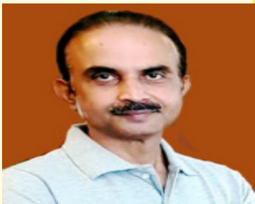
शासन लखनऊ बनाया गया है !