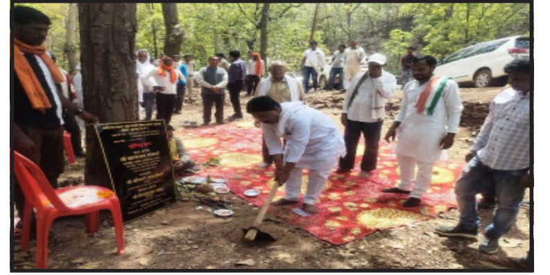
रामचंद्र जायसवाल दैनिक क्यू न लिखूँ सच

सूरजपुर- भटगांव विधानसभा क्षेत्र अंतर्गत स्थित सुदूर वनांचल क्षेत्र छतरंग पालकेवरा में आवागमन की समस्या से क्षेत्रीय ग्रामीणों एवं जनप्रतिनिधियों द्वारा भटगांव विधानसभा क्षेत्र के स्थानीय विधायक पारसनाथ राजवाड़े को अवगत कराए जाने पर क्षेत्रीय विधायक द्वारा त्वरित कार्रवाई करते हुए कैलाशनगर से छतरंग जाने वाले मार्ग में स्थित बलम्मा घाट में उच्च स्तरीय पुलिया निर्माण कार्य की स्वीकृति संसदीय सचिव द्वारा