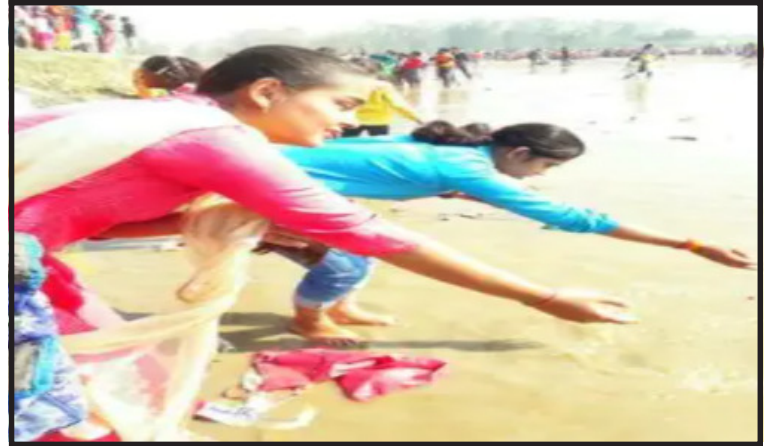
किनारे अनुष्ठान भी किए।

दैनिक क्यू न लिखूँ सच मुरादाबाद- मौनी अमावस्या पर मंगलवार को रामगंगा में श्रद्धालुओं ने आस्था की डुबकी लगाई। कड़ाके की ठंड में गंगास्नान के बाद श्रद्धालुओं ने विधि विधान से पूजा की। जरूरतमंदों को दान देकर पुण्य कमाया। ब्रह्म मुहूर्त से ही श्रद्धालुओं का पहुंचने का सिलसिला शुरू हो गया। श्रद्धालुओं ने हर-हर गंगे के जयकारों के साथ डुबकी लगाई। माघ मास की अमावस्या तिथि पर गंगा स्नान विशेष पुण्यदायी माना गया है। लोगों ने स्नान करने के साथ ही विधि विधान से गंगा मैया की पूजा-अर्चना की। सूर्यदेव को अर्घ्य देकर परिवार व समाज में सुख-शांति एवं समृद्धि की कामना की। शास्त्रों के अनुसार इस दिन गंगा स्नान व दान करना पुण्यदायी होता है। धार्मिक मान्यताओं के अनुसार, मौनी अमावस्या के दिन इन उपायों को करने से विशेष फल की प्राप्ति होती है। गंगा स्नान के बाद भगवान विष्णु और शिव की आराधना का भी विधान है। गंगास्नान के बाद श्रद्धालुओं ने जरूरतमंदों को दान दिया। बहुत से श्रद्धालुओं ने भंडारों का आयोजन भी कराया। गंगा